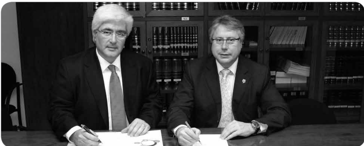
El dia 18 de febrer el nostre Col·legi va renovar l'acord de col·laboració amb Sage Logic Control.