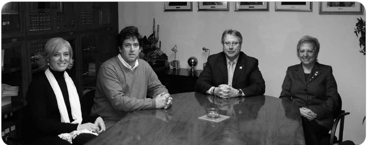
El 3 de febrer de 2010 el nostre Col·legi va subscriure un acord de col·laboració amb Diga 33, empresa especialitzada en Serveis de Prevenció de Riscos Laborals.