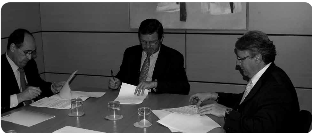
Moment de la signatura de l'acord de col·laboració amb la Universidad a Distancia de Madrid (UDIMA), que va tenir lloc el dia 6 de juliol.