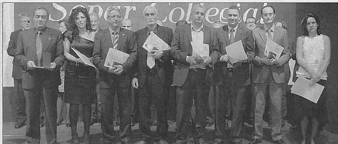
En la categoría de bronce de la Medalla al Mèrit Professional se reconoció a ocho colegiados. La razón de este galardón es la permanencia ininterrumpida de los premiados en el Col·legi durante 15 años.