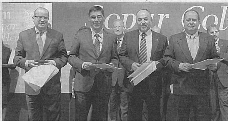
Los colegiados con más de 25 años de permanencia en el Col·legi obtuvieron la Medalla al Mèrit Professional en la categoría de plata.