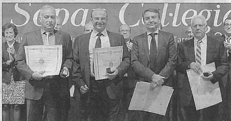
Los colegiados con más de 20 años de permanencia en el Col·legi, con la Medalla Corporativa al Mèrit en el Treball en la categoría de oro.